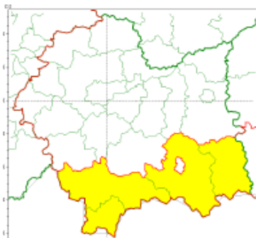
Oblodzenie 2022-03-09 13:36